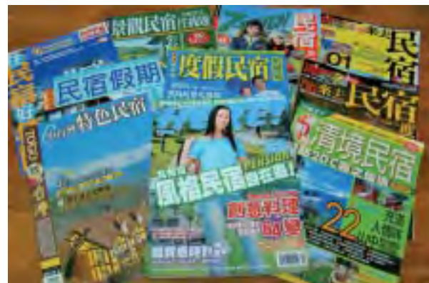
❷ 錯把pension當民宿的雜誌