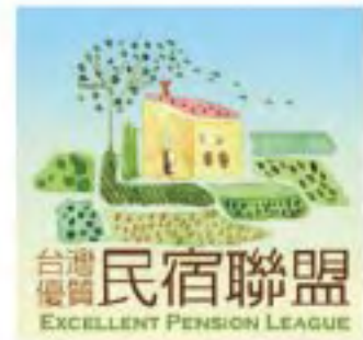
台灣優質民宿聯盟