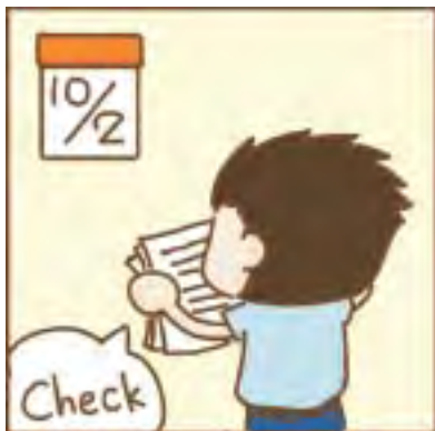
主人回電行前確認及提醒住房須知