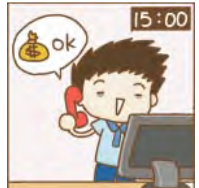
主人回電確認匯款成功