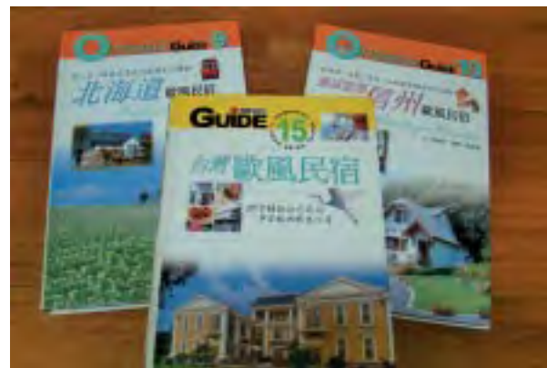
❶ 錯把pension當民宿的專書

並明定其定義及設立要件。」在此一時空背景下，本人乃於2010年接受交通部觀光局委託執行「微型住宿產業可行性之研究」，此所稱之「微型住宿產業」，並非現行法律規範用語，主要考量將較大規模之民宿納入旅館業管理規則規範之適法性與可行性，以協助輔導將較大規模之民宿合法化。換言之，此一委託計畫所指「微型住宿產業」係指「非採副業經營模式之民宿」而言，並不包括日租套房、出租套房、商務套房在內。