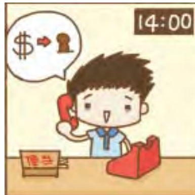
客人來電告知已匯款