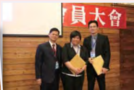
本會顧問跟獲獎同學及指導教授合影