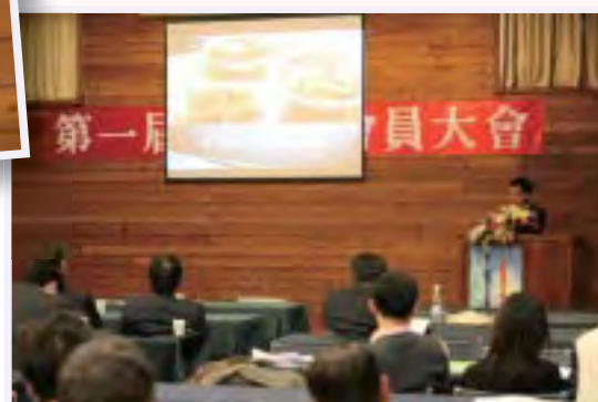
得獎者發表成果與民宿主人交流