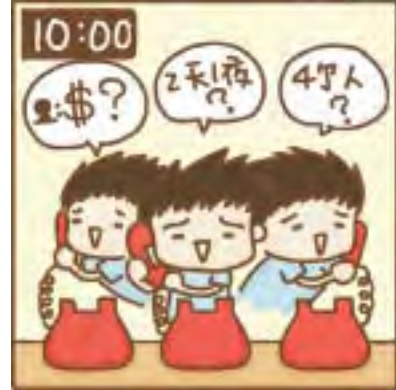
客人來電詢問空房及房價